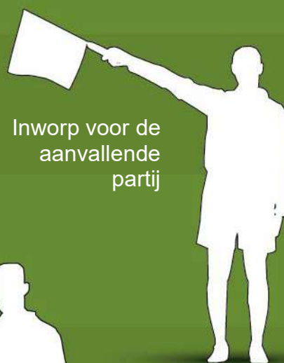
Inworp voor de aanvallende partij