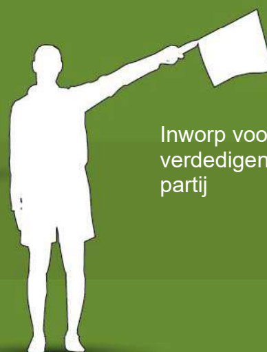
Inworp voor de verdedigende partij